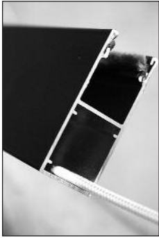
a Schnur durch Hohlkammer der Führungsschiene (FS) ziehen.