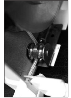
⚠ Bitte darauf achten, daß das Seil in der BK auf der Außenseite der Doppelrolle sitzt.