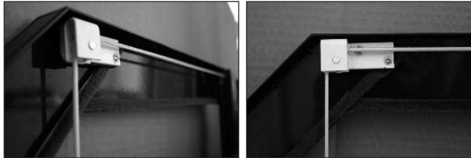
f Schnur durch Umlenkrolle am oberen Abschlusswinkel führen.